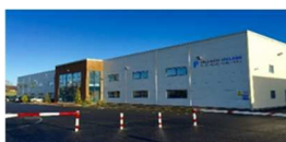
Tullamore – Irlanda