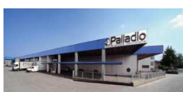
Thiene – Vicenza, Italia