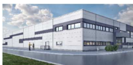
Obninsk – Russia

Questa edizione del Codice Etico (di seguito “Codice”) è stata approvata dal Comitato di Direzione di Palladio Group S.p.A. il 1° ottobre 2020 e reso disponibile a tutti i dipendenti nella bacheca aziendale e sul sito intranet.