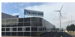
Pontedera – Pisa, Italia