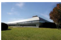
Dueville - Vicenza, Italia (quale anche Sede Legale).

Le relative attività vengono svolte presso i propri Stabilimenti di: