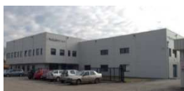
Vršac – Serbia